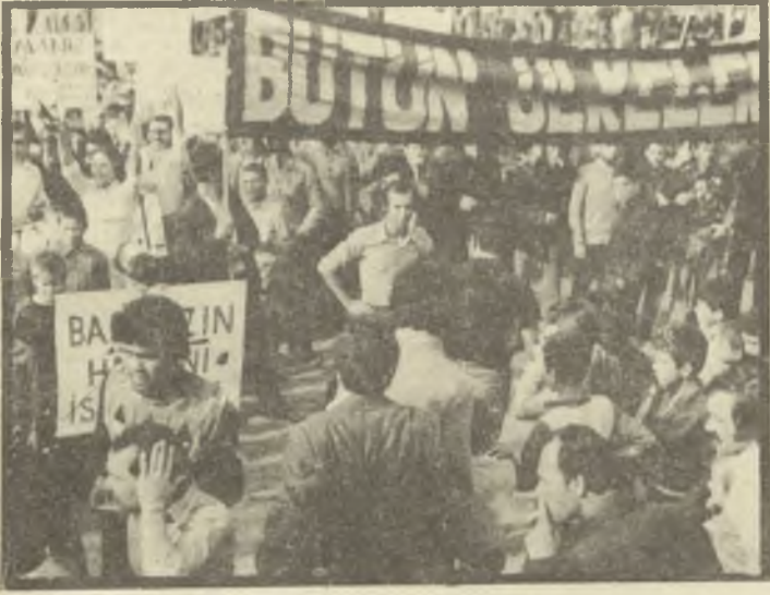
MİTINGTEN BİR GÖRÜNÜŞ

Arkadaşlarının işine son verildiğini öğrenen ve Petrol -