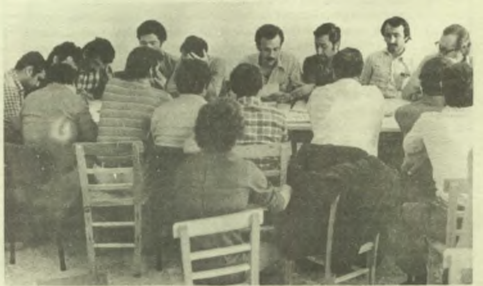
Teknik eleman örgütleri basın toplantısında.