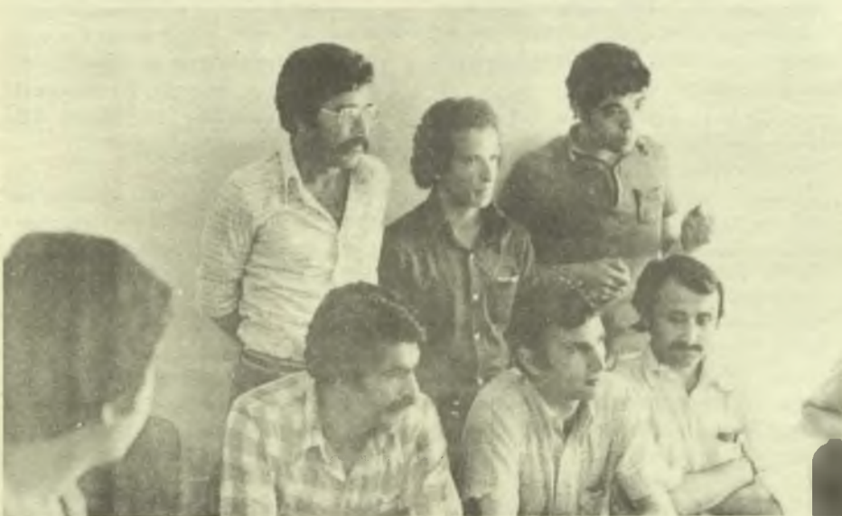
İSDEMİR'den çıkarılan teknik elemanlar.

Şüphesiz burjuvazi ve onun iktidarları baskı ve kıyımlara devam etmek, ilercilerin elindeki tüm mevzileri almak isteyeceklerdir. Ancak sonucu belirleyecek olan, onların istekleri değildir. Bu saldırıları, başta işçi sınıfı olmak üzere tüm çalışanların ortak karşı çıkışı ile safdışı etmek ve yeni mevziler elde etmek olanaklıdır. Bunun için örgütlü olmak, çalışanların birliğini sağlamak, her türden saldırıya kitlesel bir şekilde karşı durmak gereklidir.