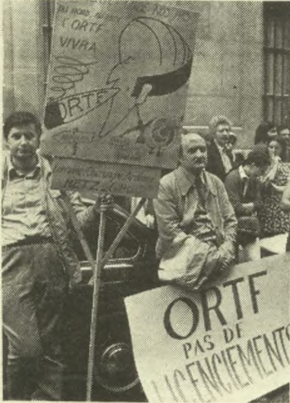
Fransa'da idari ve teknik personel "Yerimiz, burjuvazinin değil işçi sınıfının yanındadır."